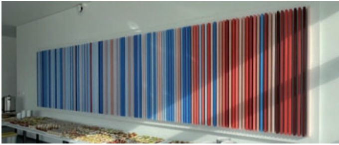
Klimastreifen-Kunstwerk im Eingangsbereich des ZSW; Realisation: ZG Architekten (Ulm) und Schreiner Späth (Burgrieden) basierend auf Idee von Ed Hawkins und Bruno Burger; Datenquelle: Deutscher Wetterdienst DWD, Climate Data Center (CDC), Copyright: Frauenhofer ISE/energy-charts.inf; Bildrechte: Tiziana Bosa, ZSW Ulm

Das Kunstwerk „Klimastreifen“ strahlt mit seinen bunten Farbstenen eine Modernität und Dynamik aus, welche die Besuchenden des Zentrums für Sonnenenergie- und Wasserstoff-Forschung (ZSW) in der Wissenschaftsstadt Ulm in ihren Bann zieht. Auf den zweiten Blick wird deutlich, dass hier eine sehr bedrohliche Dynamik sichtbar wird, nämlich die Klimakrise. Jede Stele steht für eines der letzten 100 Jahre. Die Farbe Blau markiert die kühleren Jahre, Orange und Rot stehen für die heißen. Die Reihe endet 2022. Das heißeste der letzten 100 000 Jahre, nämlich 2023, kommt im Kunstwerk also noch nicht vor.