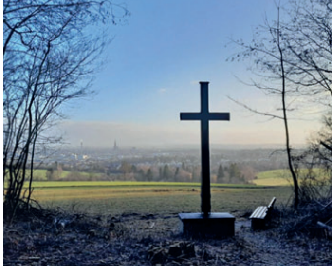
Gepflegter Aussichtspunkt im Klosterwald mit Wegkreuz

Besonders im Waldgebiet Schanze bei der Schönstattkapelle wurde durchforstet und erntereife Fichten eingeschlagen. Bei der nun folgenden Holzrückung werden die entasteten Stämme für die Holzabfuhr an die Waldstraße gebracht. Bei der aktuell vorherrschenden feuchten Witterung ohne dauerhaften Frost stellt dies eine Belastung für die Waldwege dar. Sie werden matschig und verschmutzt. Das kann in den Augen der Waldbesucher ein Ärgernis sein, da Schuhe und Kleidung etwas in Mitleidenschaft gezogen werden. Aber für den Waldumbau und den