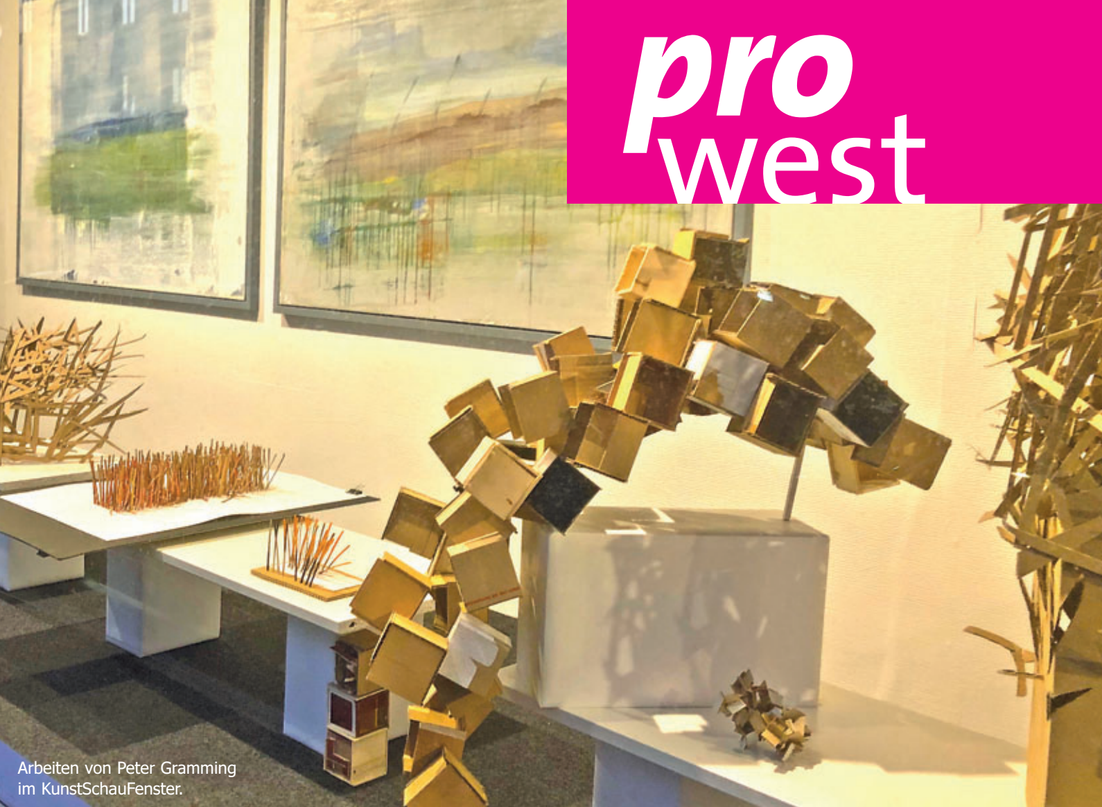
Arbeiten von Peter Gramming im KunstSchauFenster.